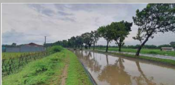
Berada dekat dengan aliran sungai

Kondisi lahan saat ini adalah persawahan yang ditumbuhi tanaman padi dengan kemiringan yang relatif datar.